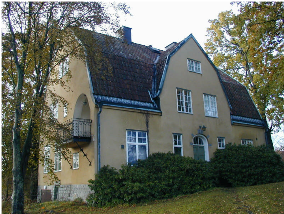
Sindre 2, Sindrevägen 3 (omr. B38)

Frid 1 omfattas av q-bestämmelser i detaljplanen.