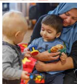
Invigningen av den nya familjecentralen lockade både stora och små besökare.

SE VECKOTEMA I SLUTET AV TIDNINGEN OCH PÅ DANDERYD.SE/FAMILJECENTRALEN