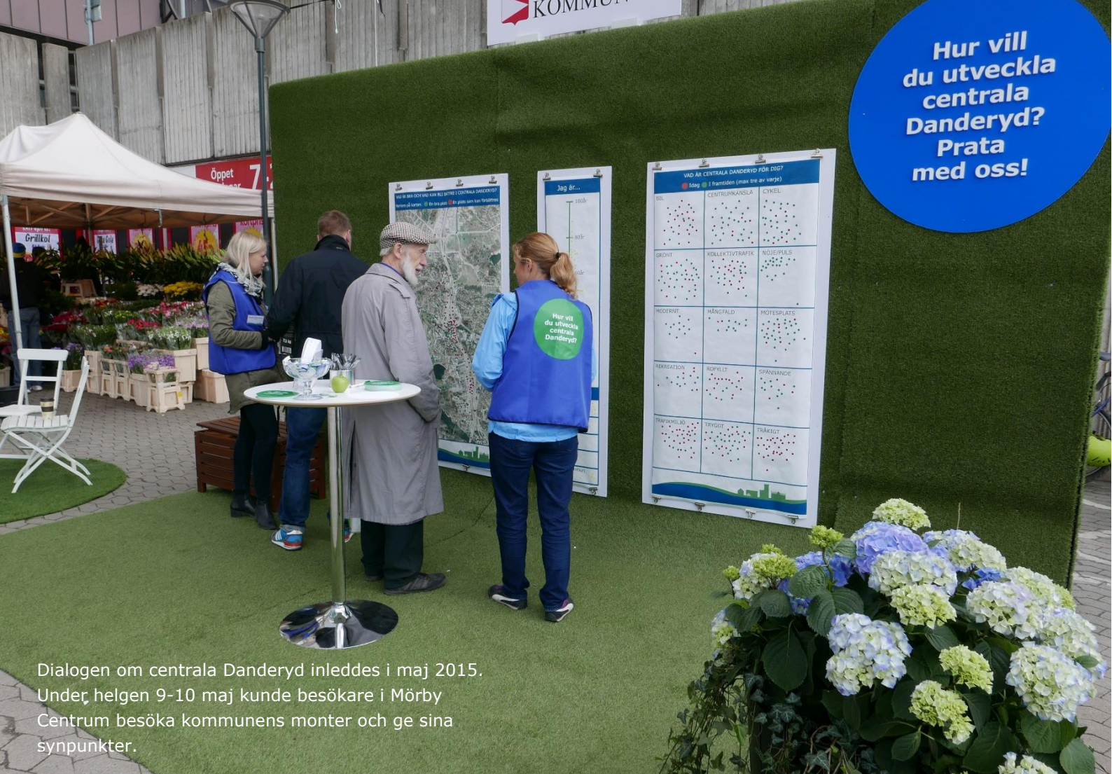
Dialogen om centrala Danderyd inleddes i maj 2015. Under helgen 9-10 maj kunde besökare i Mörby Centrum besöka kommunens monter och ge sina synpunkter.

I maj i år inledde kommunen en dialog om centrala Danderyd. Dialogen handlar om hur man kan skapa en tystare miljö med renare luft längs E18-stråket och samtidigt utveckla centrala Danderyd på bästa sätt.