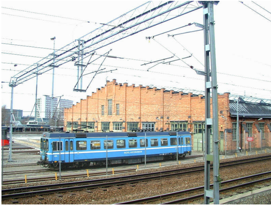
Mörby verkstäder, Stocksund 3:168